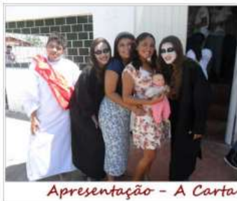
Apresentação - A Carta

No total foram 5 apresentações que encantaram a todos que estavam na mostra, a Unidade Eusébio apresentou a dança cênica "LIFEHOUSE", com questionamentos sobre os vícios do mundo, como as drogas, álcool e prostituição de uma pessoa que abandonou Deus completamente e que ao desenrolar da trama vai reconstruindo sua vida, a Unidade do IEP Eusébio ainda apresentou a peça teatral "A Carta"