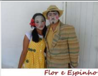
Flor e Espinho

A Feira contou com a participação de alunos das unidades de Pacajus, Horizonte, Chorozinho, Maracanaú, Itaitinga e Eusébio, além do apoio e patrocínio das empresas Sucos do Brasil Jandaia, Vincunha, Vulcabrás, PCA, Cobap, Beach Park, Três Corações e Pardal em um total de mais de 200 pessoas presentes.