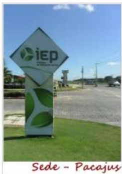
Sede - Pacajus

16:05 JORNAL CULTURA DA TERRA NO COMMENTS