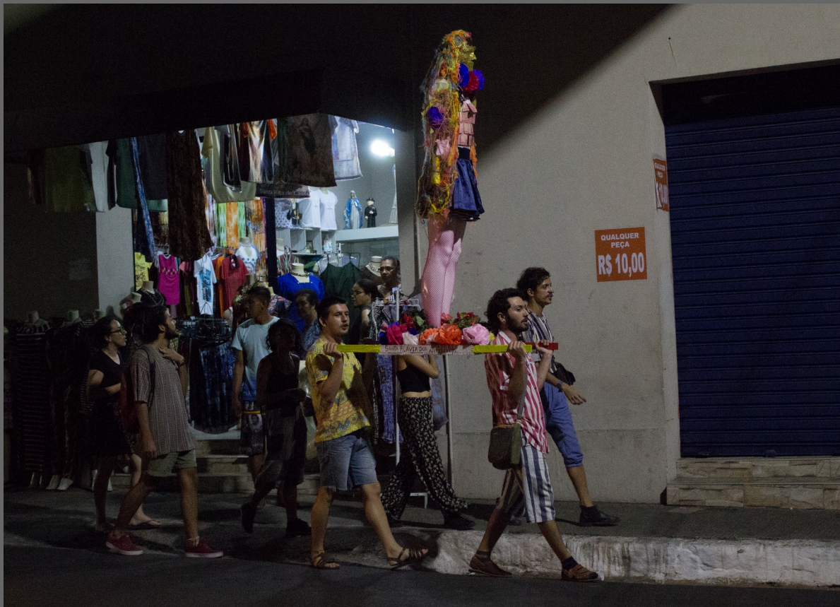
Santa Flávia dos Afazeres Artísticos, 2019 Happening coletivo

Trabalho onde as e os artistas refletem sobre a cultura e sua relação com a religião, sobre como muitas vezes assumimos uma fé cega e não questionamos ou pensamos sobre o que dedicamos nossa fé. A ação foi executada durante uma das grandes romarias de Juazeiro do Norte. A ação era composta pelo andor com a Santa, benditos e vivas, santinhos e uma procissão, que foi seguida por fiéis que estavam pela cidade.