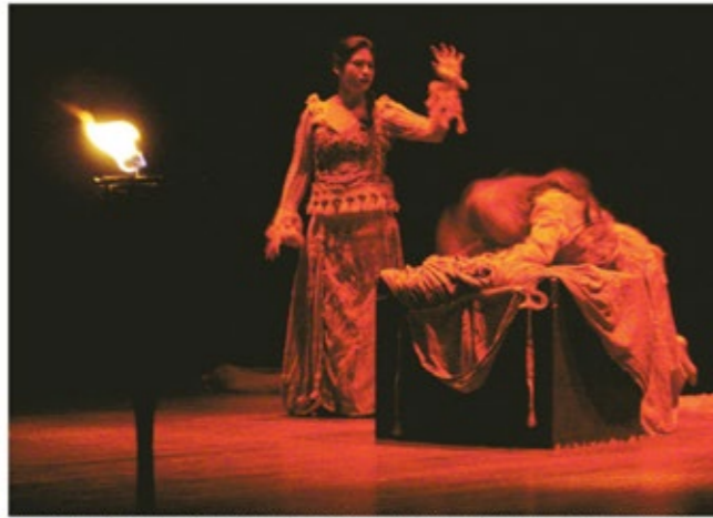
6 | A COMPANHIA Tedan apresenta em Curitiba o espetáculo "Medeia - Círculo de Sangue", o único cearense a ser encenado no festival