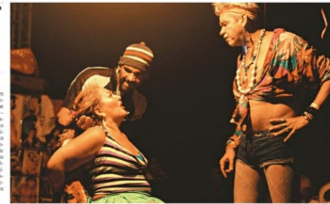
6 | CENA DO espetáculo "Abajur Lúlia" encenado pelo Grupo Imagens de Teatro, dirigido pelo paulista Edson Cláudio

Os números não mentem: no último Festival de Teatro de Curitiba (que apesar do grande número de espetáculos dificilmente reúne textos iguais) foram pelo menos quatro espetáculos com textos de Plínio Marcos, com duas encenações de "Navalha da Carne".