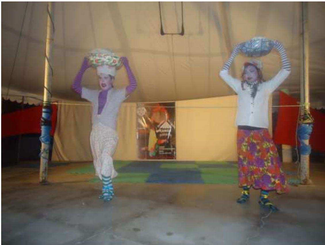
Efigie – 2010 – Direção: Arnolddo Araujo – Cia Degraus