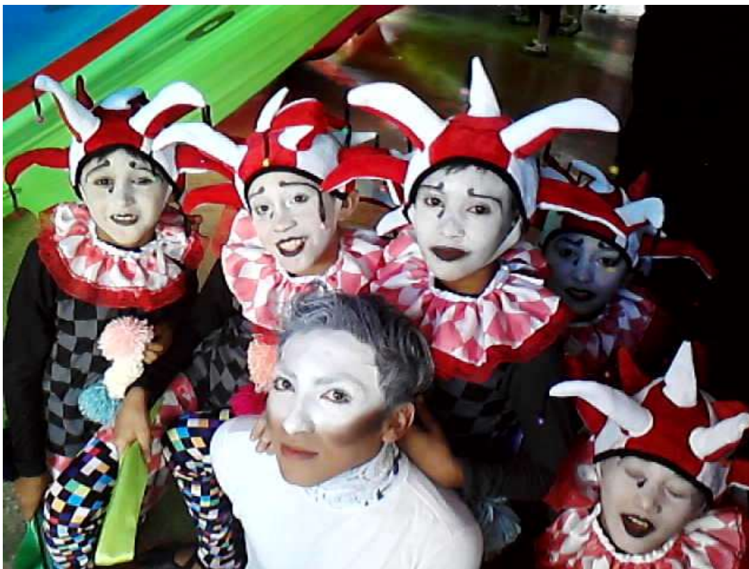
CorPoesia (Dança) – 2007 – Direção: João Paulo Freitas- Cia magote