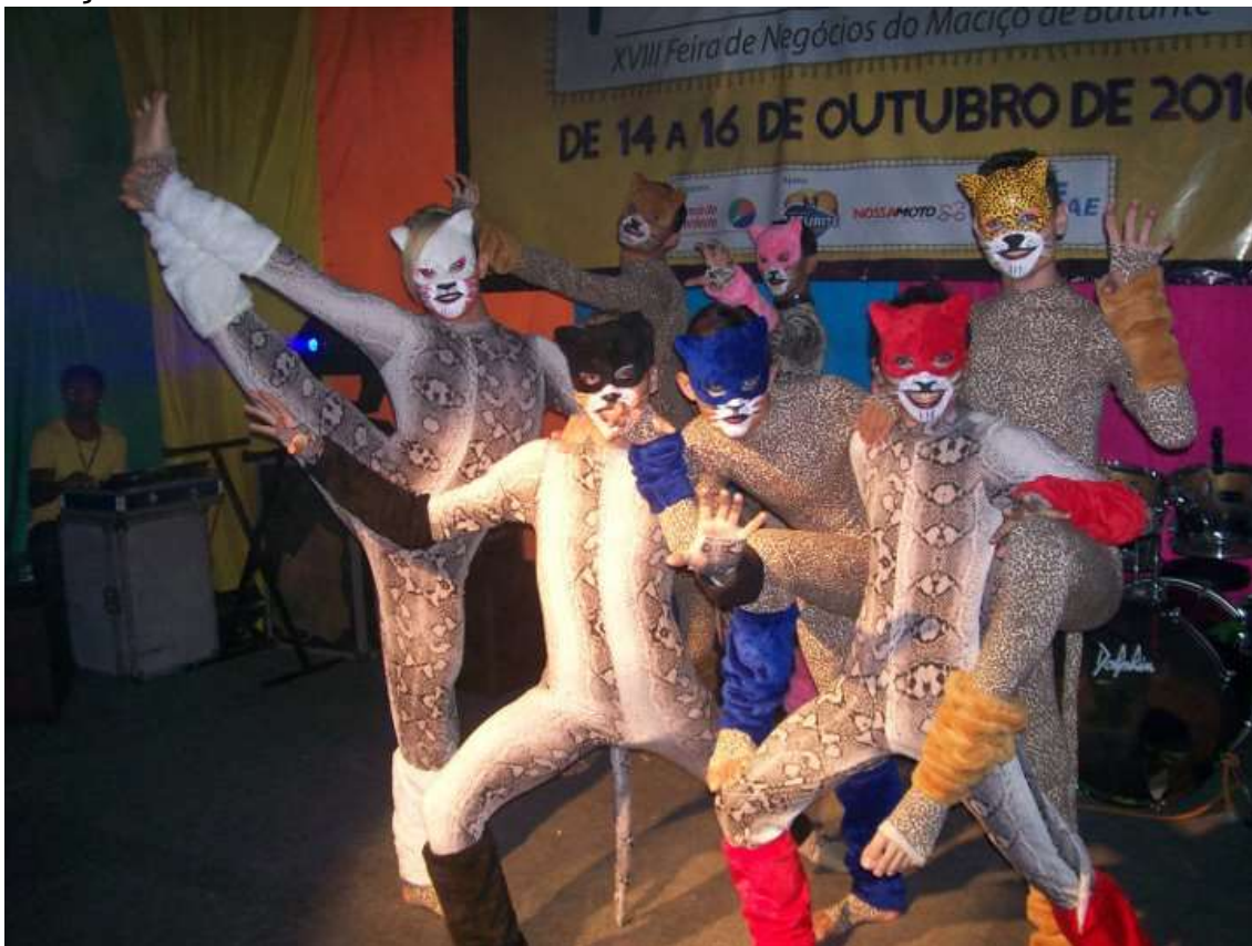
As Belas Sem a Fera – 2008 – Direção: Arnolddo Araujo – Cia Degraus